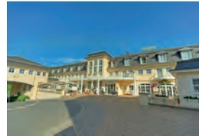
HOTEL LAHNSCHLEIFE WEILBURG