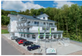
LANDHOTEL KRISTALL BAD MARIENBERG